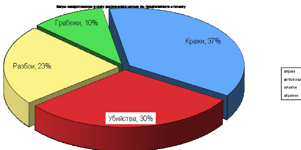
Рис.1. Структура преступности в г. Энске