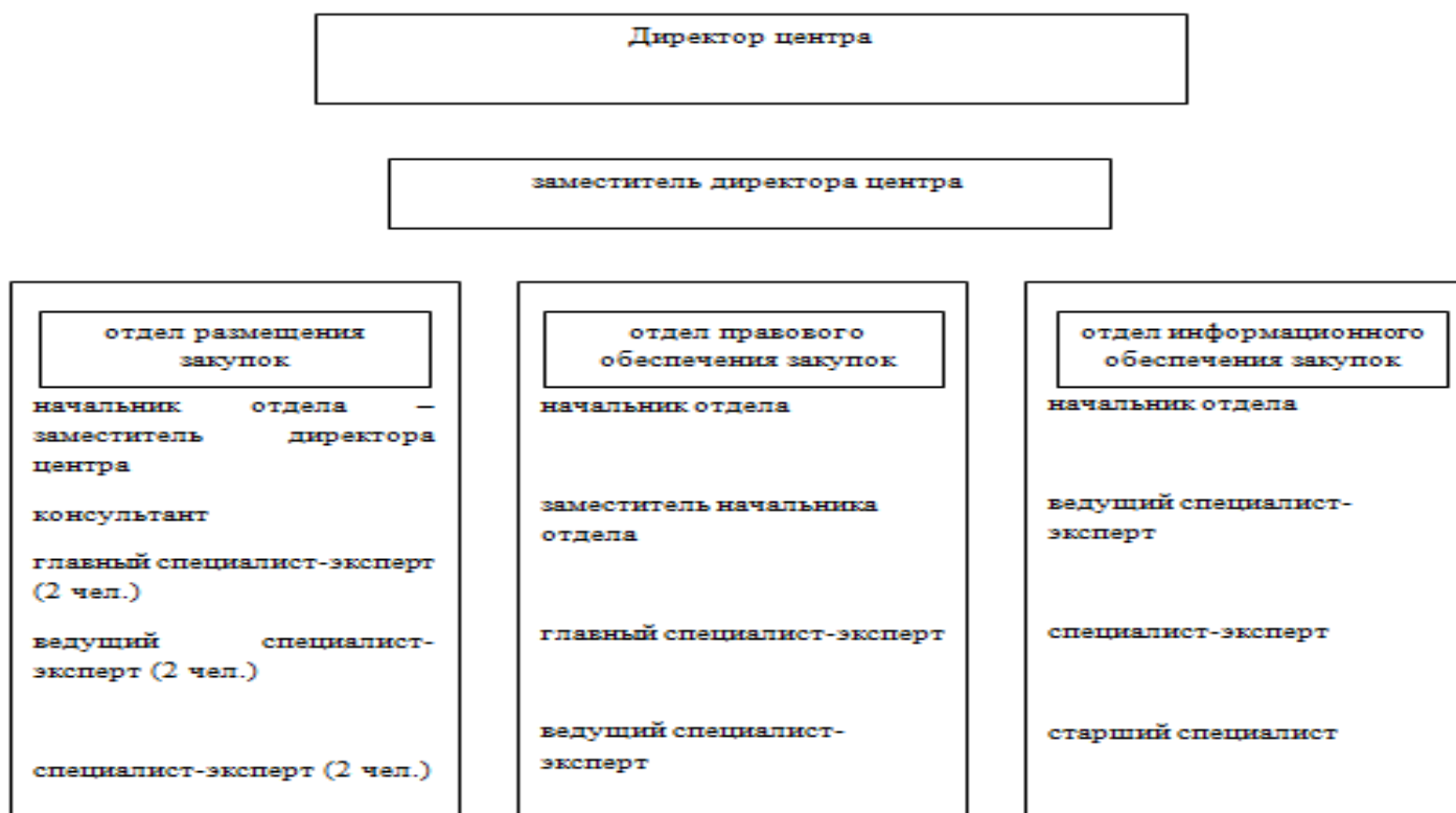
Структура ГУП Рязанской области «Центр консультирования в области закупок» (проект)

Совершенствование размещения заказа Рязанской области на строительство, ремонт и реконструкцию объектов жилищного фонда