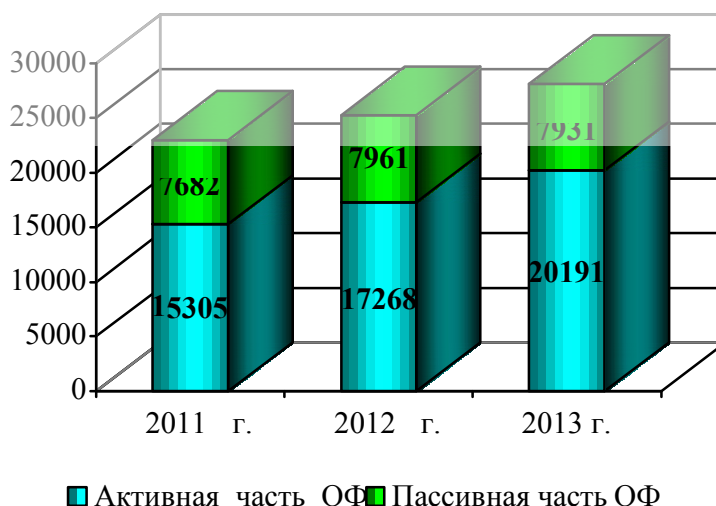
Рисунок 2 – Состав основных фондов

Графическая интерпретация динамики состава основных фондов изображена на рис. 2.